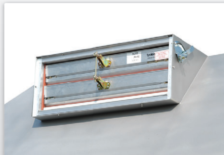
Volet d'ajustement du débit d'air (en option)