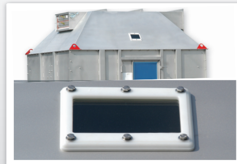
Ports d'inspection (en option)